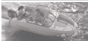
Cap Camarat 5.5 BR